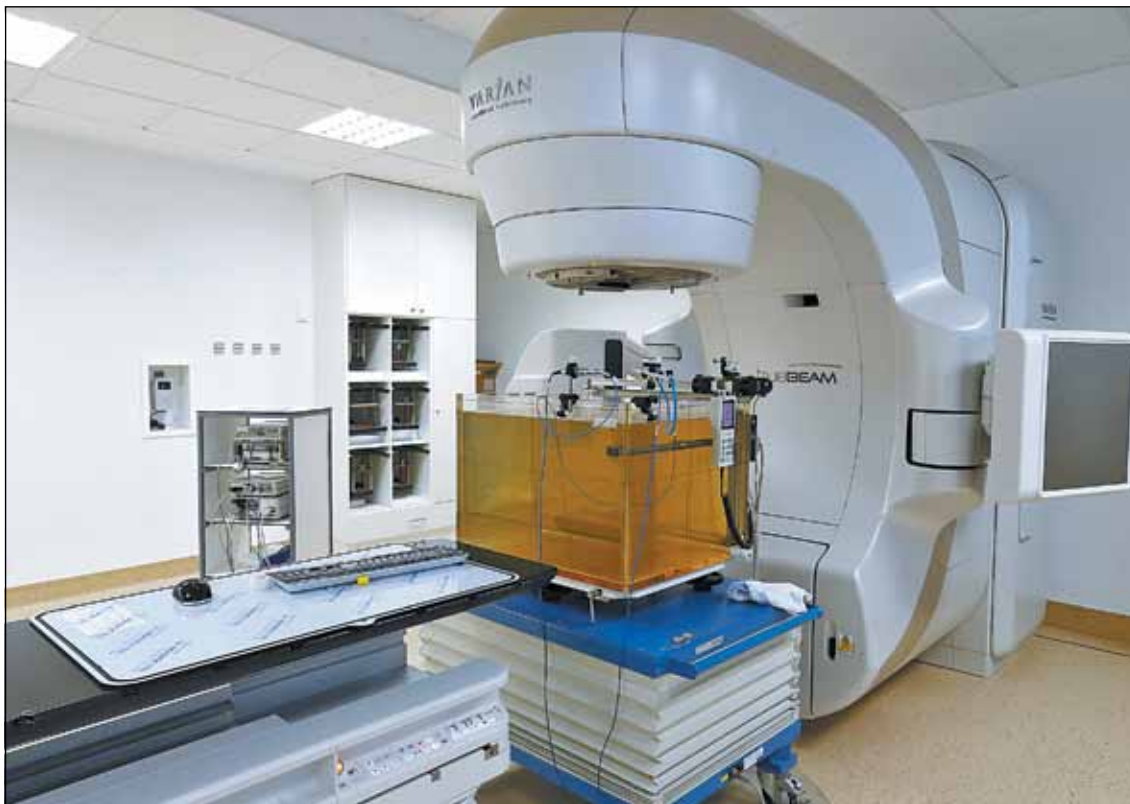
El nuevo acelerador lineal de partículas del Hospital del León para tratamiento oncológico.