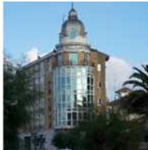
HOTEL SILKEN RÍO****