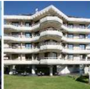
GRAN HOTEL VICTORIA****