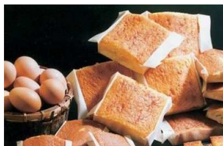
Sobaos y quesadas