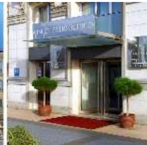
HOTEL VINCCI PUERTO CHICO****