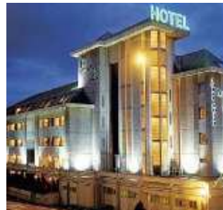
HOTEL PALACIO DEL MAR****