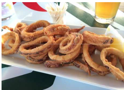
Rabas y pulpo

Los excepcionales espacios naturales de Cantabria dan lugar a una gastronomía variada que conjuga los pescados y mariscos del mar, con las carnes, leches y quesos, y los mejores productos de la tierra .